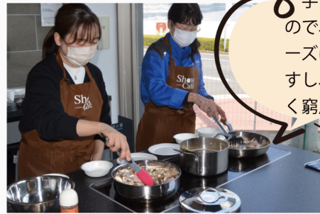
参加されたS様のご感想

手前のスペースが広いので、お皿を置いてスムーズに盛り付けができますし、二人で立っても全く窮屈さを感じません。